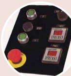
Pannello di comando per la versione temporizzata Timed version control panel Tableau de commande pour variante temporisée Tablero de mando por la versión temporizada

Dimensioni, specifiche tecniche, illustrazioni e descrizioni possono subire variazioni SENZA preavviso. Dimensions, technical specifications, illustrations and descriptions CAN undergo variations without notice. Les dimensions, les spécifications techniques, les illustrations et les descriptions sont sujets à changement SANS préavis. Tamaño, especificaciones técnicas, ilustraciones y descripciones están sujetas a cambios SIN previo aviso.